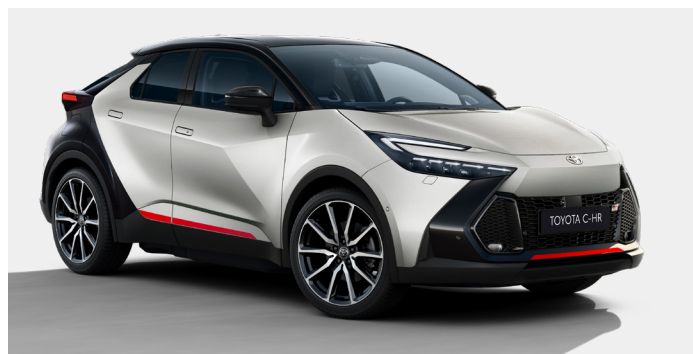
Dekoratívní polepy, 4 ks, instalace 1,2 h