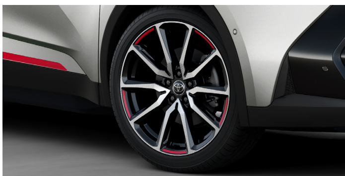
Nálepky na litá kola 20", sada na 4 kola, instalace 1,2 h