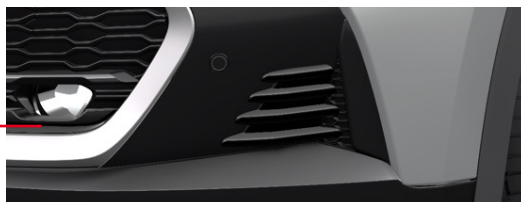
Style element u mlhových světel