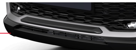
Lišta předního nárazníku