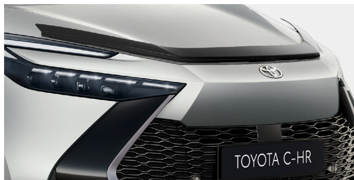
Deflektor kapoty, 1 ks, instalace 1 h