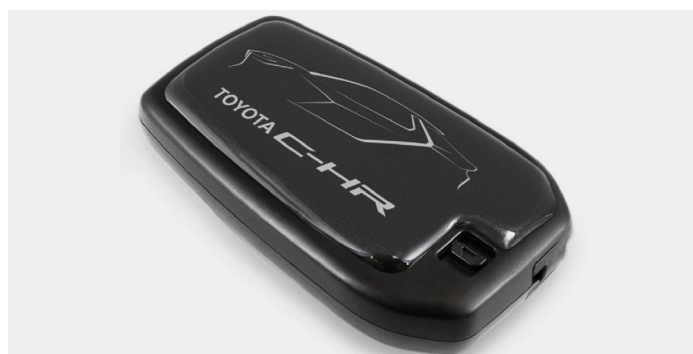
Nálepka na klíč, 1 ks, instalace 0,1 h