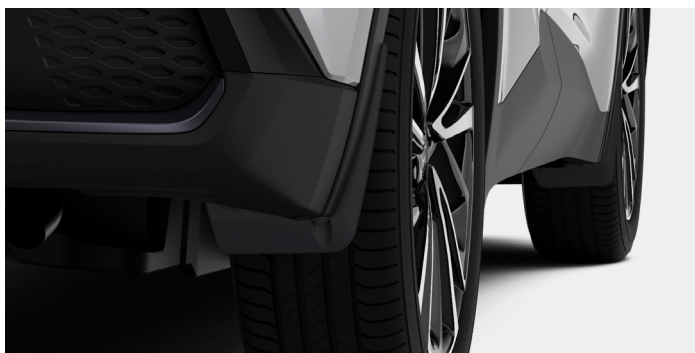
Lapače nečistot, 4 ks, instalace 1 h