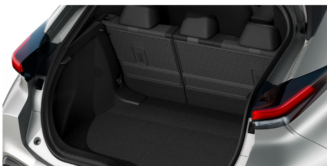
Ochrana zadní strany sedadel (40:60)