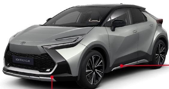
Přední spodní lišta