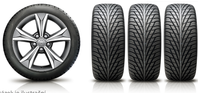
Obrázek je ilustrační.