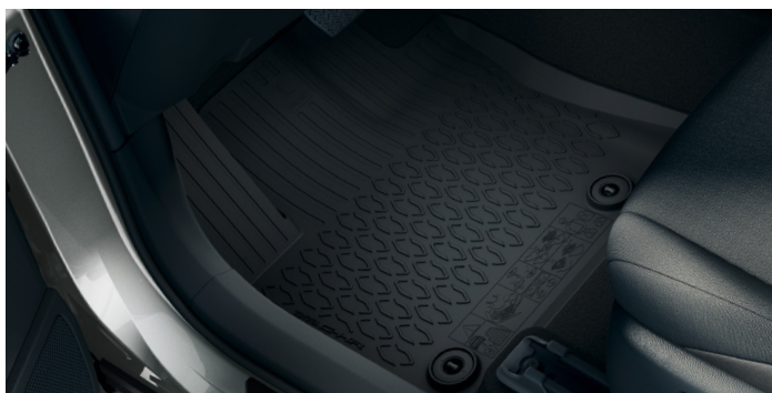
Gumové rohože, 4 ks, instalace 0,1 h