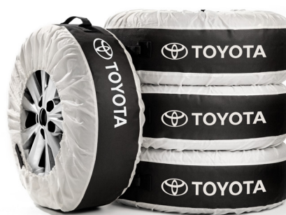
Obaly na litá kola