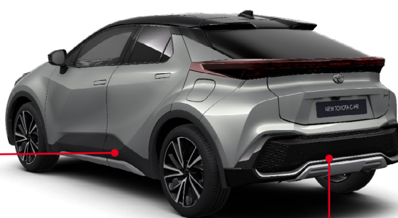
Zadní spodní lišta